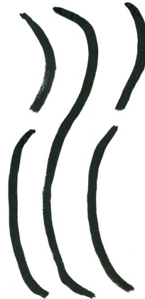
水 SHUI: das Wasser

Höchste Güte gleicht dem Wasser: Es nutzt allen Lebewesen und kämpft doch nicht. Und verweilt an von Menschen geschmähten Plätzen. So kommt das Wasser Dem Weg des Schöpfens und Wirkens nahe. Verweile auf festem Boden, Dein Verstand gleiche einer tiefen Quelle. Sei gütig, wahrhaft und korrekt im Handeln. Lenke das Dir Anvertraute mit Kompetenz. Wähle den rechten Zeitpunkt für Dein Eingreifen. Denn wer nicht kämpft vermeidet Unheil.